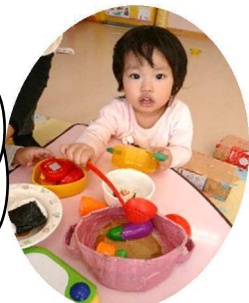
りんご組さん、 ままごと遊び 上手になったね。