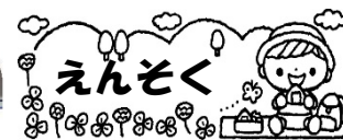
年長組 10/13 小町の郷公園