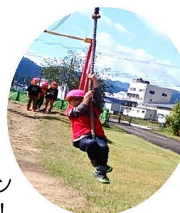
大きな遊具やターザン ロープ、楽しかったね！