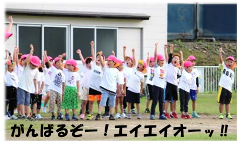
がんばるぞー！エイエイオーっ！！