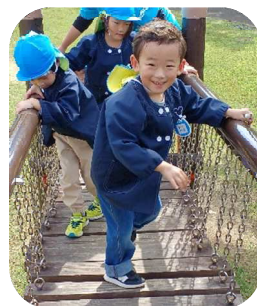
年中組 10/19 ヘルシーパーク