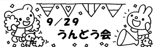
子ども達もお家の方もみんなが大活躍！ 最高の㊦んだふるスマイルでした(^_^)