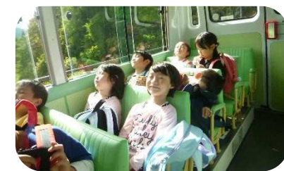
帰りのバスの中では Zzzz...