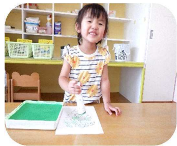
組み立てたり、描いたり、指先を使うのがみんな上手になってきたね。