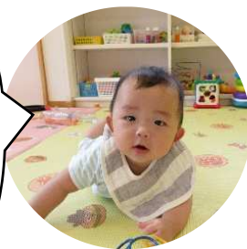
ほくも早く歩けるようになりたいな~!

芸術の秋、食欲の秋、スポーツの秋...と 過ごしやすくなってきた季節を、みんなで楽しんで います。明日はいよいよ運動会! 毎日楽しみながら 走ったり、踊ったり、友達と力を合わせてがんば っています。たくさんの応援、よろしくお願 いします!! ☆...明日天気にな~れ...☆