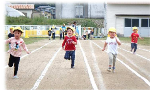
かっこいい走りをお楽しみに!