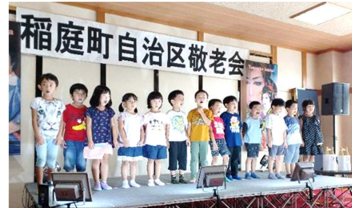
イベント盛りだくさんの年長さん。敬老会に参加したり、今週末はうどんエキスポで踊り『秋田の行事』を披露したりと、引っ張りだこです。こちらのステージもぜひご覧ください!