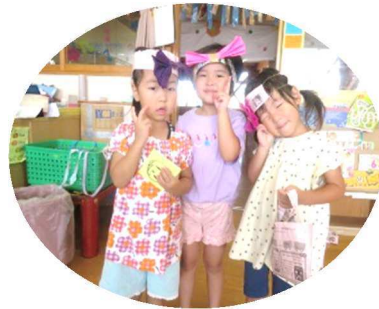
私たちはおしゃれの秋♡