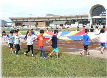
バルーンの様子をビデオチェックしながら休憩中!