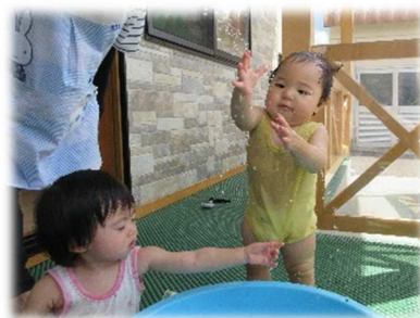
ペットボトルシャワー気持ちいい〜