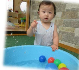
お水でお絵描き上手ですよ!