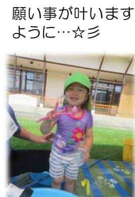
願い事が叶いますように...☆彡