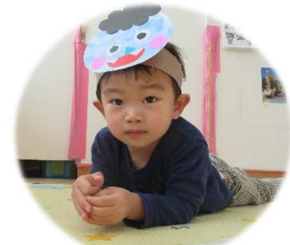
ふう~ちょっと休憩。