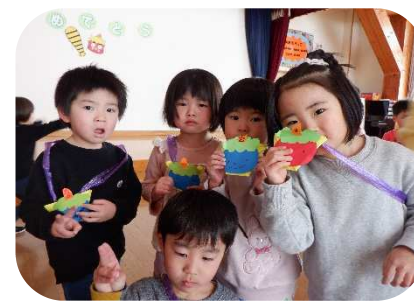
年中さん、年少さんステキなプレゼントをどうもありがとう!