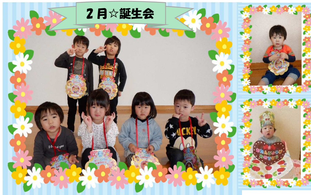
2月の誕生会は豆まきをして楽しみました。紙を丸めた豆で、元気いっぱい鬼退治をがんばりました。みんなが今年も健康に過ごせますように!