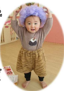
ウオーッ! 鬼だじょ~!