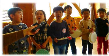
年中さんの司会、立派でした。