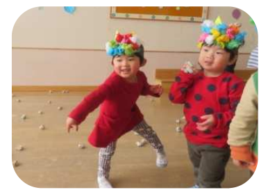
全身を使って…エイッ!