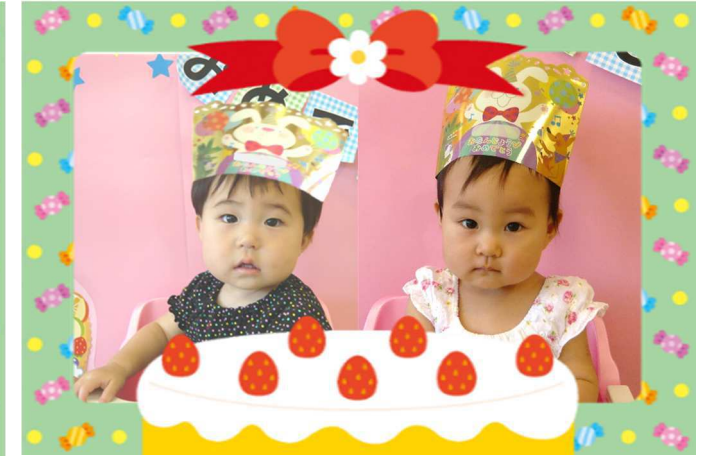
7月生まれのお友達です!