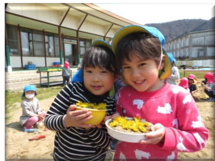
ごちそう、いかかですかー♡