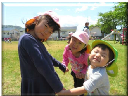
お姉ちゃん達と一緒に！