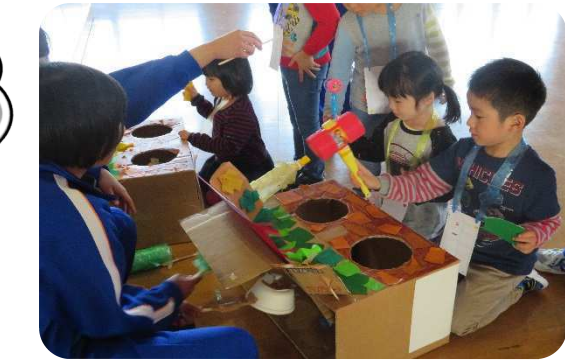
手作りのゲームを用意してきてくれました