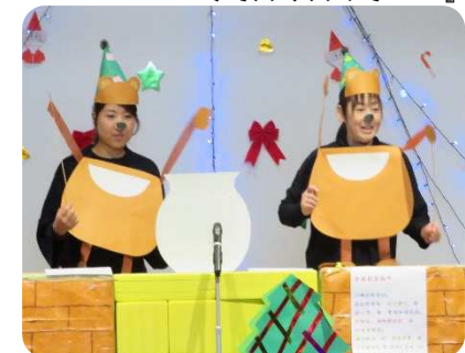
職員によるおもしろ人形風表情劇 『不思議な袋』