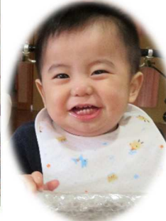
サンタさん ありがとう♡