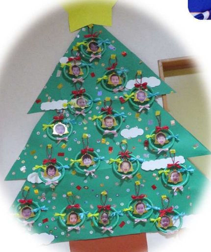
「☆もも組お手製 クリスマスツリー☆」