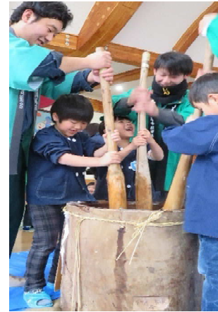
「よいしょ！よいしょ！」