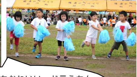
とってもかわいい、ドラえもん でした♡