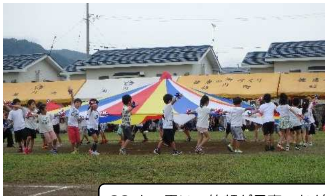
29人の思い、笑顔が見事つながりました!