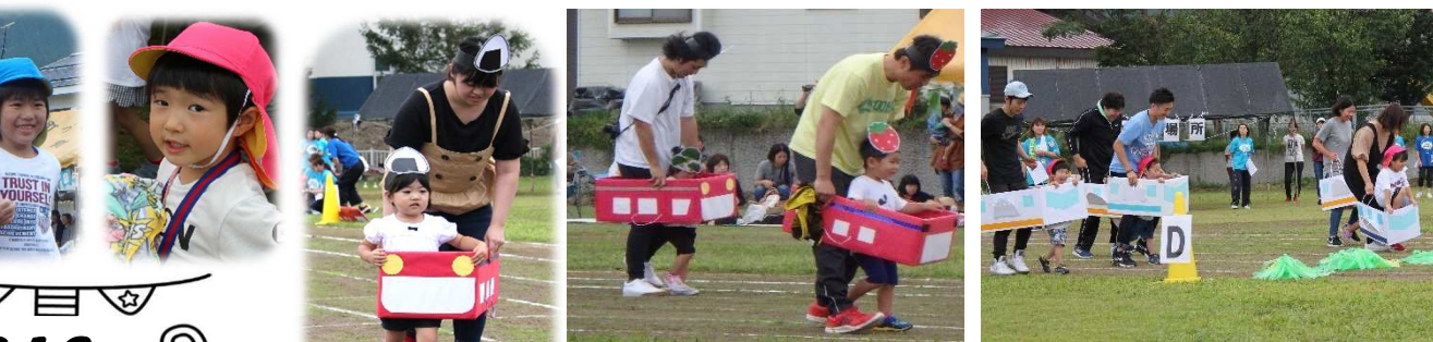
お家の人達も一緒に頑張ってくれました!