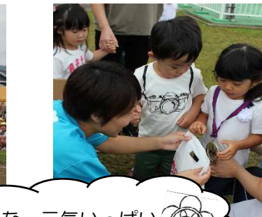
みんな、元気いっぱい がんばりました