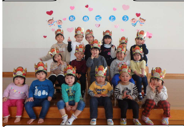
2月21日、2月生まれのお友だちのお誕生会がありました。今月のお楽しみは、職員による劇、『白雪姫』。年長のお誕生児も小人役で出演してくれました！！