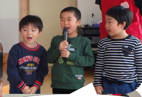
会の司会は年中組さんです！