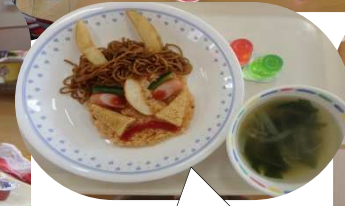
給食は鬼っこライス ペロリと完食でした！！