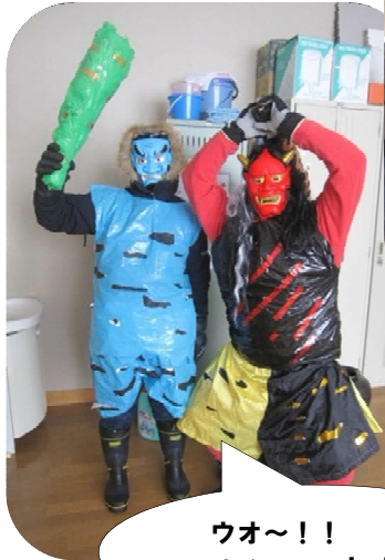
ウオ～！！ 泣ぐ子はいねが～