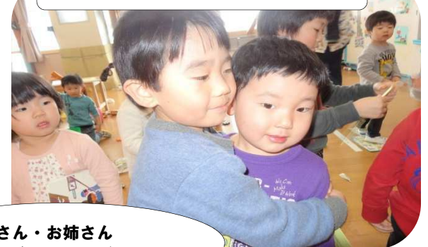
お兄さん・お姉さん 遊んでくれてありがとう♡