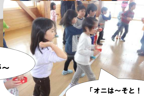
「オニは～そと！ フクは～うち！」