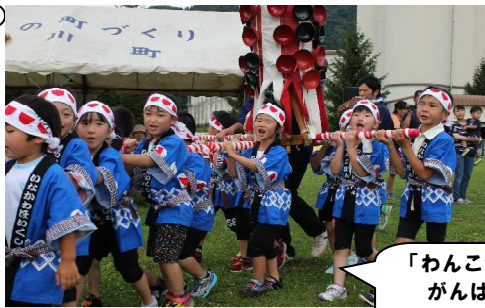
「わんこ梵天 がんばるぞー」 「エイエイオー」