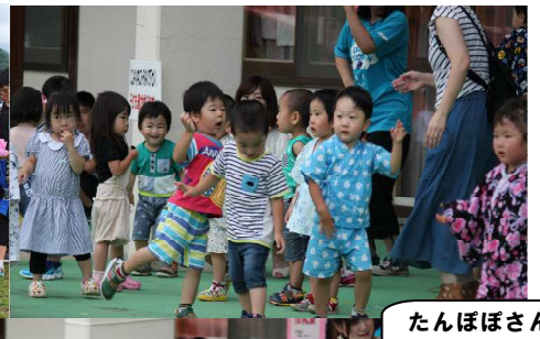
たんぼぼさんも オンステージ♪