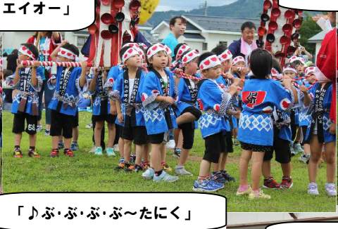
「♪ぶ・ぶ・ぶ・ぶ～たにく」