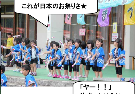
これが日本のお祭りさ★