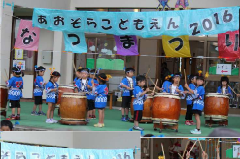
年長さんによる あおぞらこども太鼓 「かっこいい～!!」