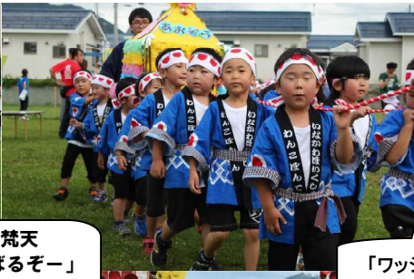
「ワッショイ」「ピッピッ」「ワッショイ」「ピッピッ」