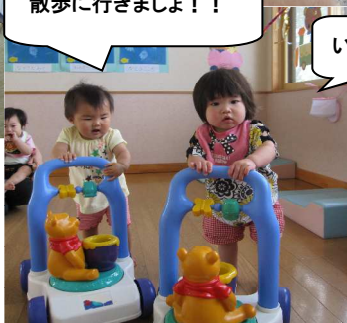
散歩に行きましょう!!