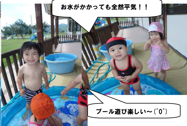
お水がかかっても全然平気!!