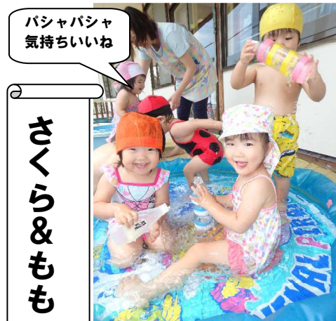
パシャパシャ 気持ちいいね