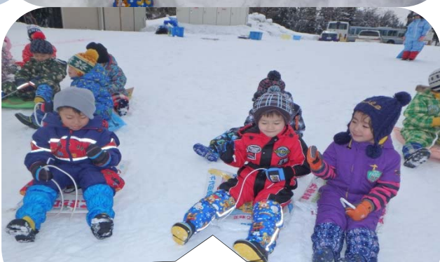
みんなで行ってきま～す！