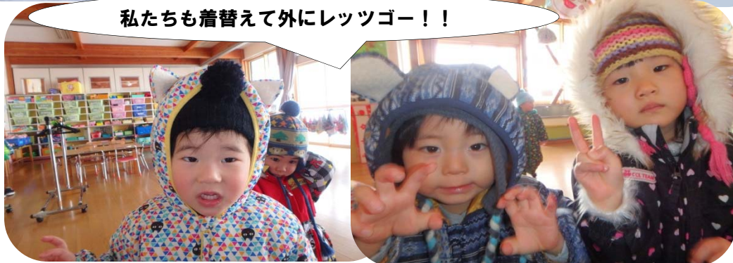
私たちが着替えて外にレッツゴー！！