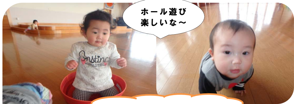
ホール遊び 楽しいな～