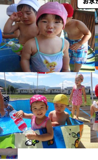
お水がかかっても全然平気!!