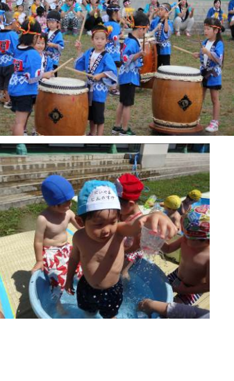
プール遊び楽しい~(´0´) 泳げるように頑張るぞー