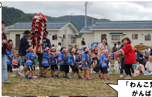
「わんこ熱天 がんばるぞー」 「エイエイオー」