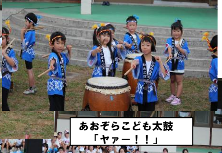
あおぞらこども太鼓 「ヤー!!!」