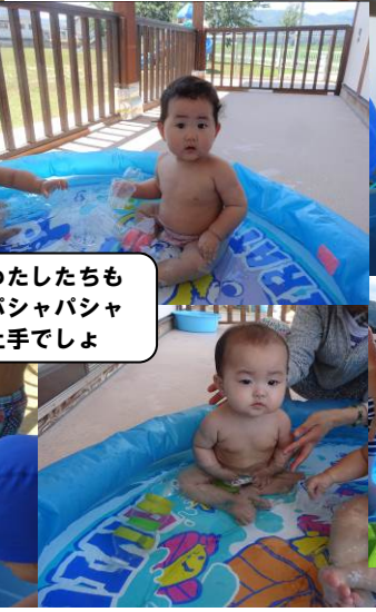
わたしたちも パシャパシャ 上手でしょ