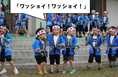
「ワッショイ!ワッショイ!」