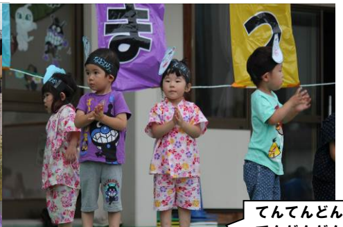
てんでんどん てんでんどん♪ みんなかわいい てんどんまんで ござんすよ