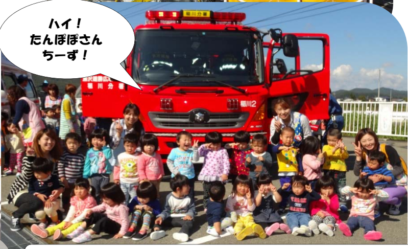
ハイ! たんぼさん ちーず!