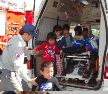
10/7 消防士さんたちが来てくれて避難訓練をしました☆