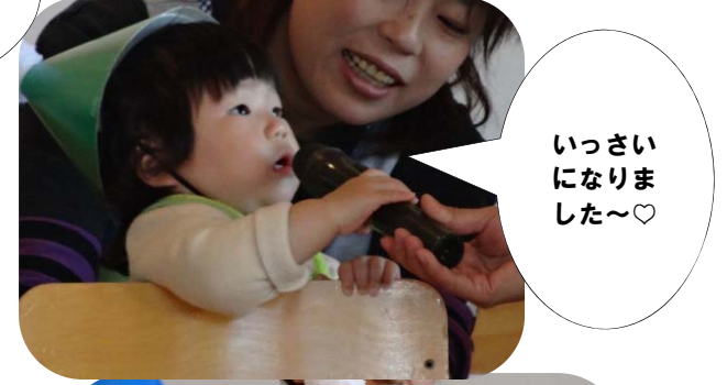
いっさい になりました～♡