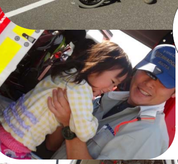
消防車カ ッコイ ネ～♡