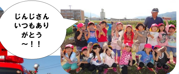
じんじさん いつもあり がとう ～!!