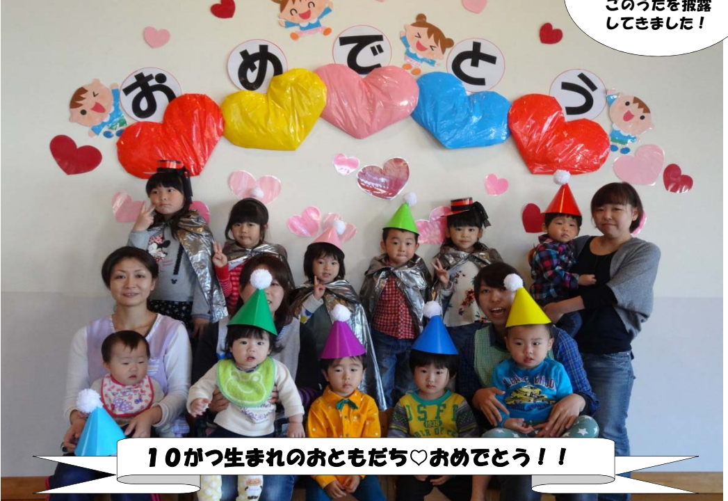
10がつ生まれのおともだち♡おめでとう!!