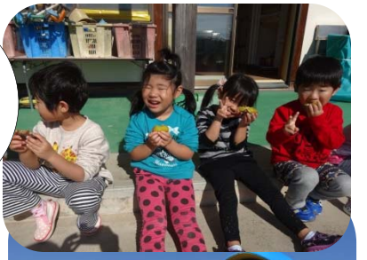
焼き芋 おいし いな～ ♡