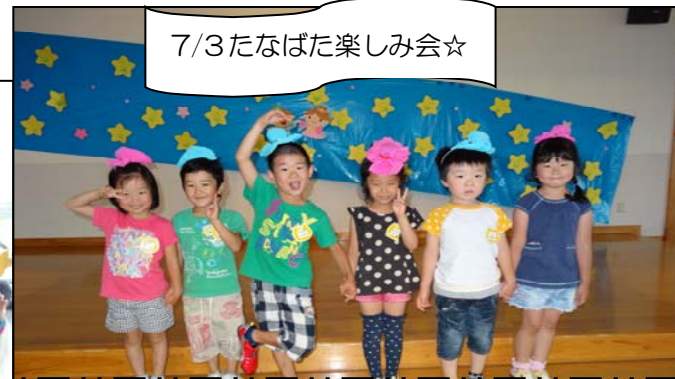
7/3 たなばた楽しみ会☆

運命のヒモを引いた織姫（女の子）と彦星（男の子）が2人組になってゴールしました♡