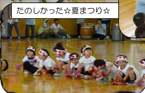
たのしかった☆夏まつり☆