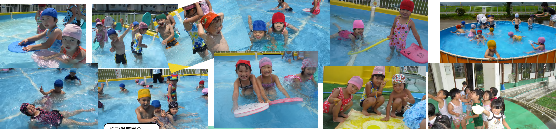
駒形保育園のお友達と一緒にあそびました。