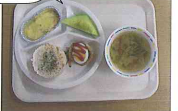
こっちは誕生会のご馳走です