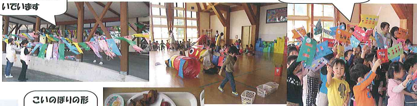
こどもの日楽しみ会です