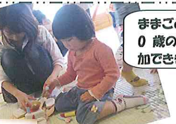
ままごとコーナー 0歳のお友達も参加できました。