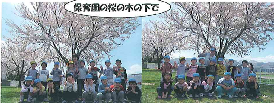
保育園の桜の木の下で