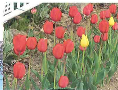
花壇のちゅうりっぷもきれいに咲きました