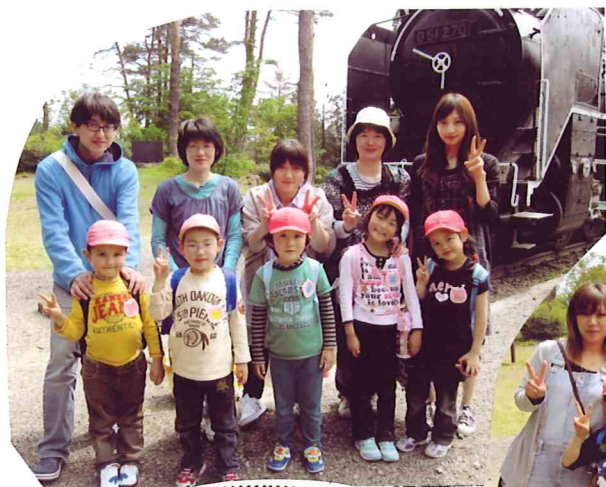
年長組さんの親子遠足！ 横手公園の機関車の前でパチリ みんないい笑顔ですね。

今日は以上児クラス中心になってしまいました。来月は未満児クラスをのせますので・・・すみません。