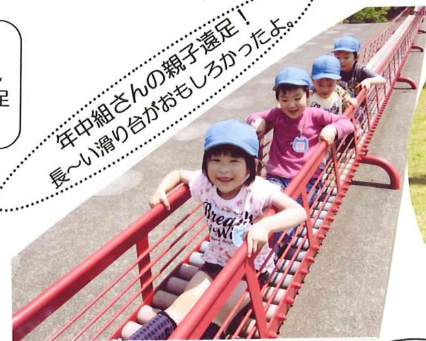
年中組さんの親子遠足！ 長〜い滑り台がおもしろかったよ。