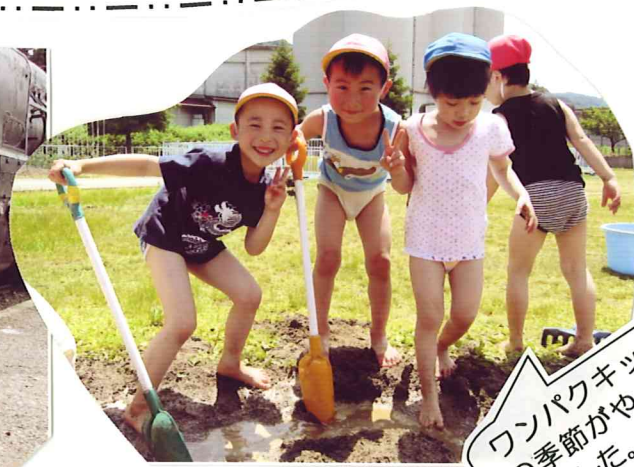
ワパクキッズ の季節がやって きました。