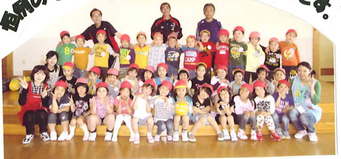
恒例のサッカー教室が終わり記念撮影です。