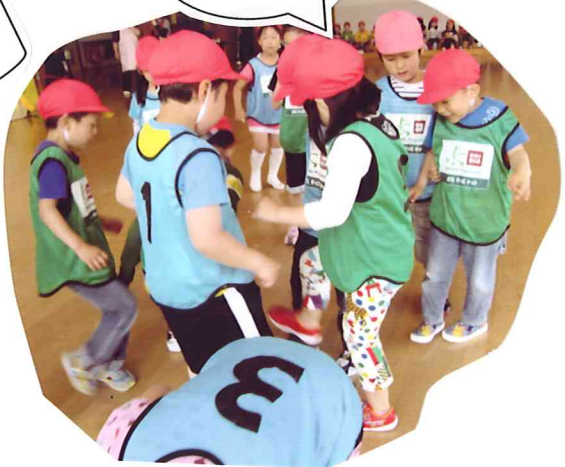
3番の子はいったい何を しているのでしょうか？