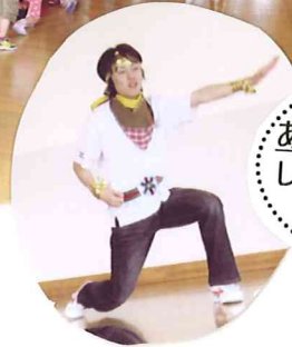
6月の誕生会&ふれ あい広場にかっこいい「野菜 レンジャー」がやってきまし た。ポーズが決まってい るね！