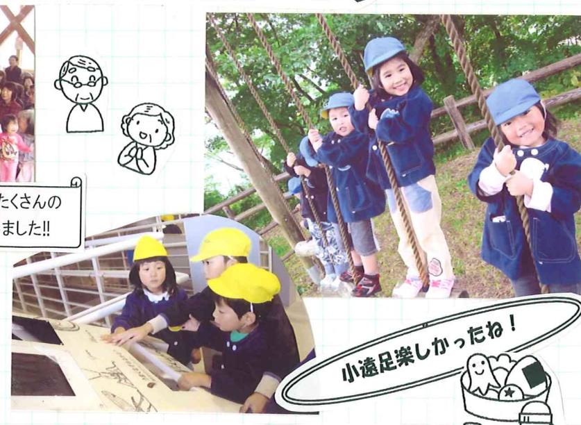
小遠足楽しかったね!