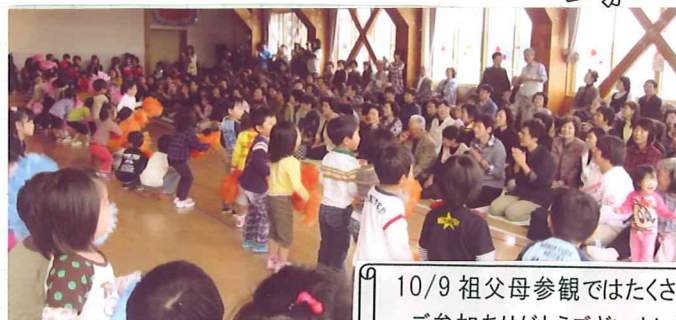
10/9 祖父母参観ではたくさんのご参加ありがとうございました!!