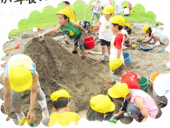
ビックマウンテン~!!