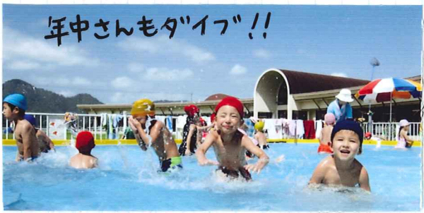
年中さんもダイブ!!