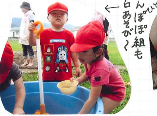
たんぽぽ組も ドロドロでたべるよ!