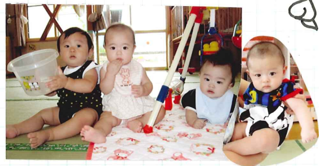
もも組もこんなに大きくなりました