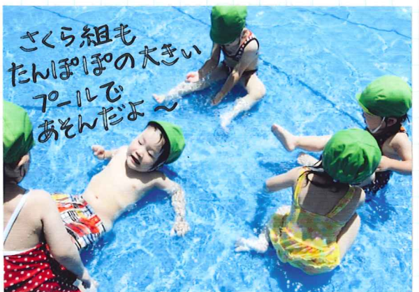
さくら組も たんぽぽの大きい プールで あそんだよ~