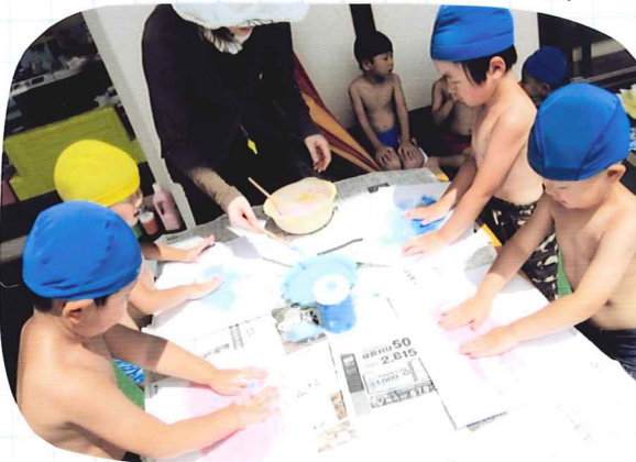
年少さん フィンガーペインティング☆