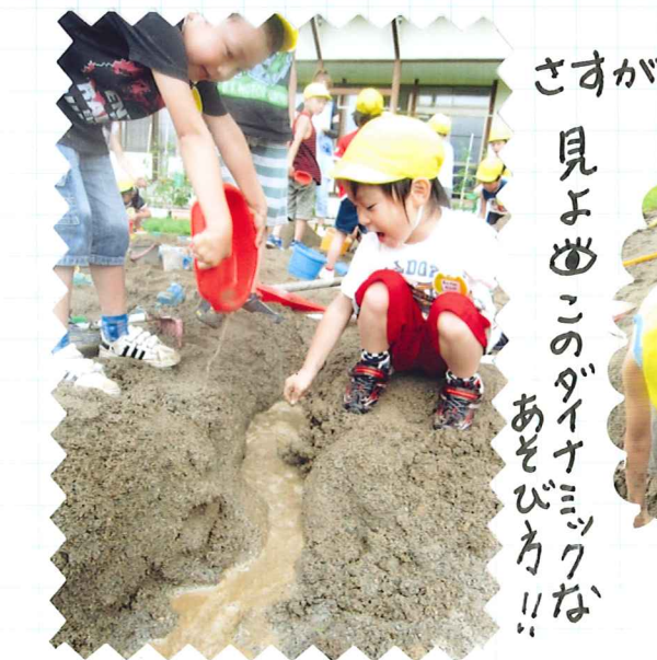
さすが年長!! すごくでしょ~